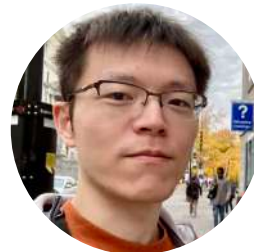
筑波大学 / 人間総合科学学術院 UT / Graduate School of Comprehensive Human Sciences

The experience of discussing the interdisciplinary theme of an inclusive smart society with people from diverse backgrounds was highly stimulating. It became evident that one's thinking is significantly shaped by past experiences and that what feels self-evident to one person may not necessarily hold true in different cultural or community contexts. This experience was also immensely valuable as training to approach issues from multiple perspectives.