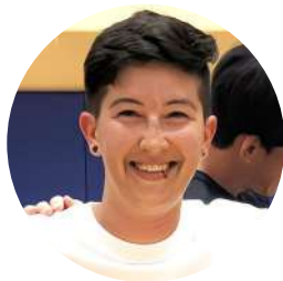
オハイオ州立大学 / 教育・人間生態学部 OSU / College of Education and Human Ecology