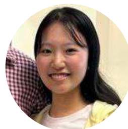
筑波大学 / 理工学群 UT / School of Science and Engineering

They seemed to shine with confidence gained from previous learning and anticipation for their further growth. I will continue to study hard to greatly improve both my language skills and technical abilities, and I hope to discuss with them again in the future. I will take advantage of these experiences to start exploring a bigger world and expand my possibilities.