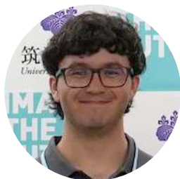
オハイオ州立大学 / 文理学部 OSU / College of Arts and Sciences

Experiencing judo and kyudo was a valuable cultural immersion through which I learned respect, traditions, and honor in each respective discipline. One extremely memorable event was joining the activity class with the physical education undergraduate students. As a PhD student studying physical education, this experience was extremely valuable to me. Through collaboration, we strengthened our bonds, and the friendships I made are ones I will cherish for my lifetime and will serve as the beginning of collaborations in research and education.